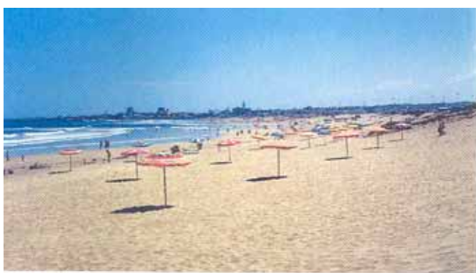
Plage d'Aïn Diab

La qualité de la construction et des services offerts par les cafés et restaurants implantés sur la plage porte préjudice à l'esthétique de cette plage. Compte tenu de sa situation et de la volonté des responsables locaux d'adhérer au label « Pavillon Bleu" il y a lieu pour les autorités et la commune de mener un travail en profondeur pour améliorer l'esthétique générale de cette plage.