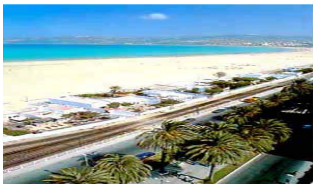
Plage Municipale Asilah

Nota : Compte tenu des grandes charges de Maroc Telecom au niveau de la plage Municipale de Tanger et des plages limitrophes, il y a lieu de recadrer l'engagement à la plage d'Asilah qui constitue un fleuron du tourisme balnéaire.