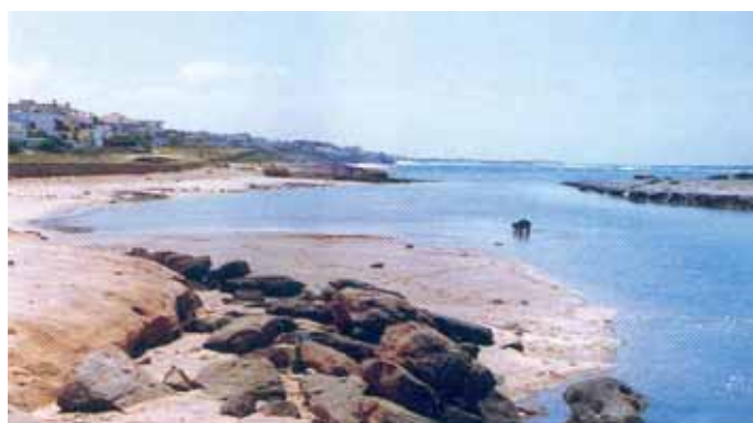
Plage de Harhoura

Observation Générale : L'ensemble du chapelet des plages au sud de Rabat nécessite un cadre général à élaborer avec la commune et l'autorité afin de capitaliser les efforts du sponsor qui semblent actuellement éparpillés. Le travail important fourni par le sponsor apparaîtra alors dans le cadre d'un développement intégré et à long terme.