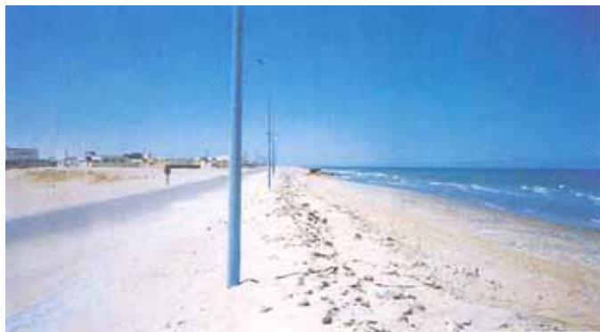
Plage de Foum El Oued

La commission n'a pas effectué la deuxième visite inopinée sur la plage de Foum El Oued.