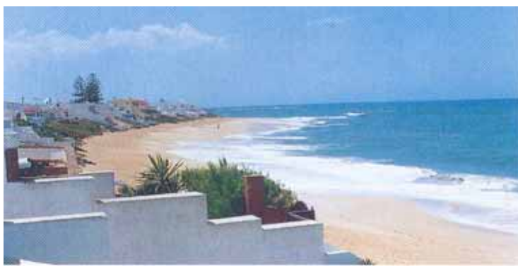
Plage de Bouznika

Il a été constaté qu'une très bonne coordination est instaurée entre la commune, le sponsor et l'autorité locale ce qui n'a pas manqué d'avoir des répercussions favorables sur l'avancement des travaux programmés dans le cadre de la convention, d'ailleurs une nette amélioration est apparente aussi bien au niveau des aménagements que de la gestion et de la sécurité sur la plage de Bouznika. L'important effort consenti par le sponsor se trouve amoindri par les nuisances notamment sonores dues aux activités d'animations lancées par la commune. Notons par ailleurs la solution apportée au rejet des eaux usées dans un semblant de lac où se baignaient des enfants.