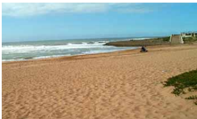
Plage de Contrebandiers