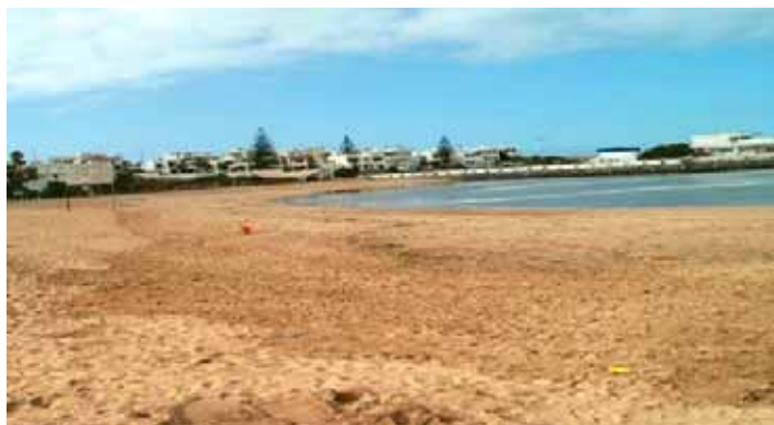
Plage de Sidi El Abed

Il y a lieu de noter l'implication d'une association "brigade de plage" à Sidi Abed qui constitue par ailleurs un exemple à analyser afin de favoriser ce type d'implication et de partenariat avec des associations locales.