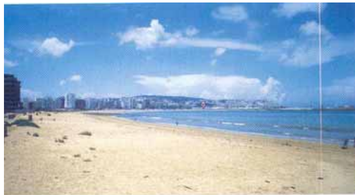
Plage Municipale de Tanger

Le sponsor a fait un grand effort au niveau de la plage de Tanger et son apport est apparent L'état général de la plage est satisfaisant. Néanmoins et dans l'optique des critères du « Pavillon Bleu », certains problèmes doivent être maîtrisés dans les meilleurs délais (fosses septiques, blocs sanitaires et problème des jet skis)