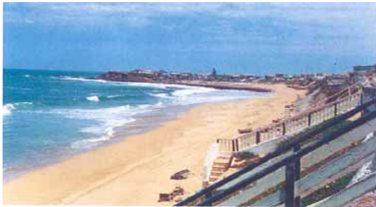
Plage de Dahomey

Malgré les efforts méritoires et la bonne volonté du sponsor, ainsi que la bonne qualité du sable de la plage, celle-ci du fait de construction et d'aménagement qui y ont été réalisés au fil des années nécessite l'implication des autorités et élus locaux pour définir les stratégies de développement et les discuter avec le sponsor.