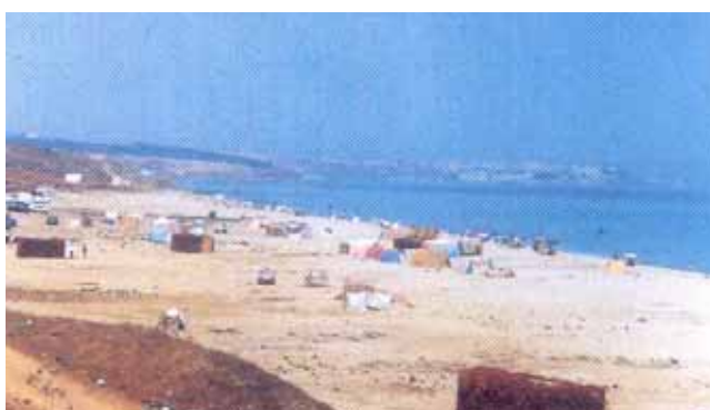
Plage de Fnideq

Il y a lieu de régler ces préalables pour permettre au sponsor d'engager les actions claires et pérennes.