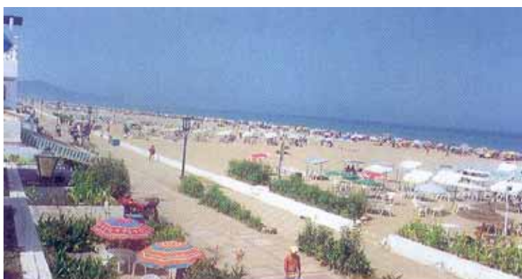
Plage de Martil

Nota : Il y a lieu de se pencher sur le problème d'ensablement de la corniche.