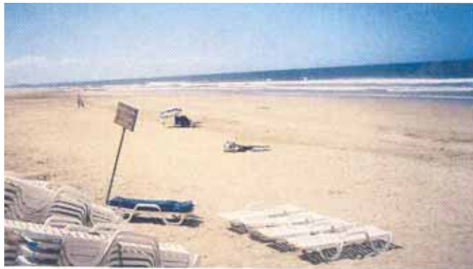
Plage de Taghazout

Problème de vision claire pour l'aménagement de cette plage à cause du projet de la station balnéaire ARGANE BAY