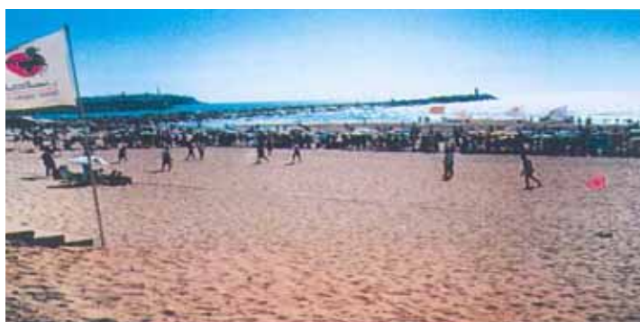
Plage d'El Haouzia

Le respect des critères du label « Pavillon Bleu » nécessite une véritable implication de la commune qui doit prendre conscience de son rôle dans le travail à mener.