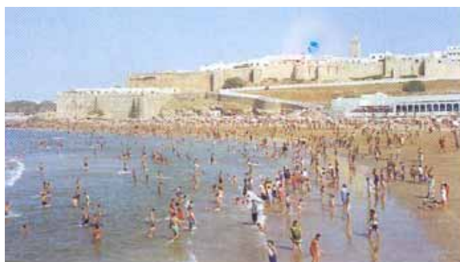
Plage de Rabat

Le sponsor a fait un gros effort au niveau de la plage de Rabat, ce qui a permis notamment de solutionner dans des délais courts le problème d'érosion imprévue, alors que cet aspect n'était pas inclus dans la convention. Cette action à par ailleurs, entraîné le Ministère de l'Equipement et du Transport à engager une étude en vue de solutionner le problème à long terme et fournir aux estivants une plage de qualité.