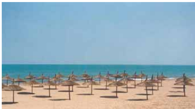
Plage Municipale Saidia