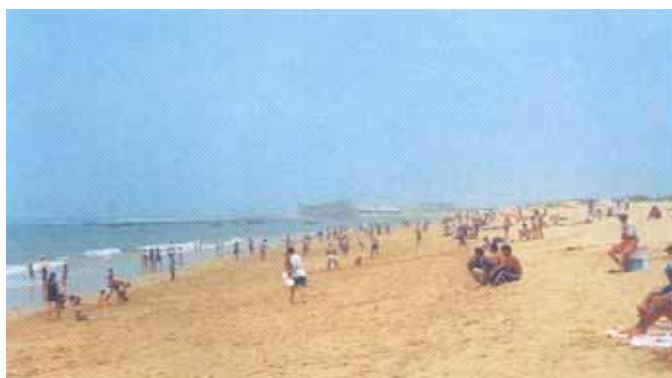
Plage de Souria Kdima

La commune ayant retardé l'entrée en vigueur des termes de la convention, ce qui a eu des effets négatifs sur le déroulement global de l'opération, pour laquelle le sponsor s'est entièrement mobilisé pour respecter ses engagements