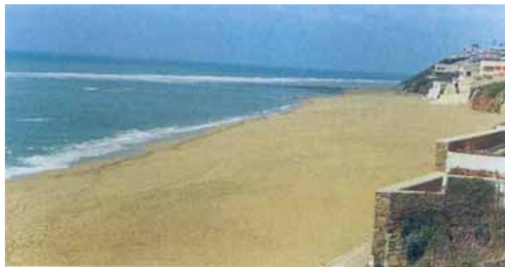
Plage de Moulay Bouslham

Compte tenu de l'importance et de la qualité de cette plage, il est nécessaire d'établir un véritable partenariat sponsor-commune pour donner une visibilité aux actions du sponsor