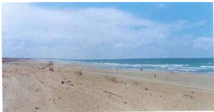
Plage de Mehdia

La plage souffre d'un problème d'érosion et manque d'infrastructures. Le partenariat triennal entre le sponsor et la commune devrait être mis à profit pour engager des opérations de mise à niveau. Il y a lieu pour la commune de définir ses priorités et les examiner avec le sponsor dans le cadre d'une vision à long terme.