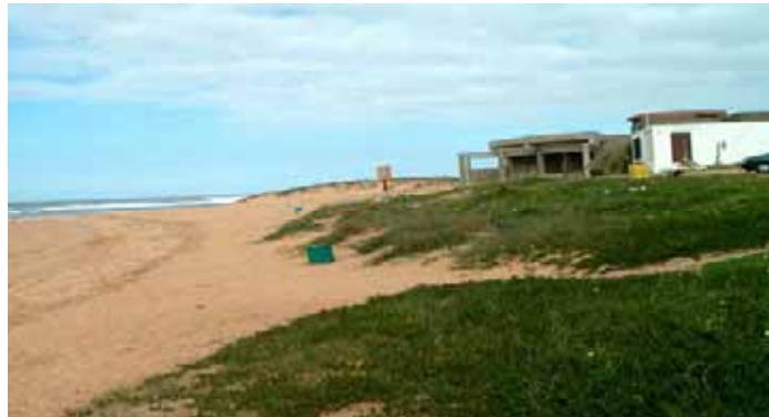
Plage de Val d'Or