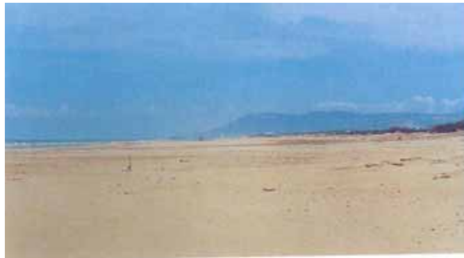
Plage de la Forêt Diplomatique