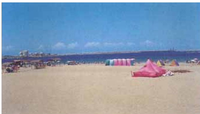
Plage de Mohammedia Centre

La plage de Mohammedia mérite une forte implication de la commune pour faciliter le travail du sponsor. L'état des équipements et la gestion de cette plage sont défectueux et la commune a tout intérêt à se concerter avec le sponsor pour définir un cadre de travail adéquat et sur le long terme.