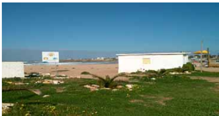
Plage les Sablettes

La commune doit s'impliquer davantage pour faciliter le travail du sponsor et rechercher avec lui les voies et moyens d'aboutir à un projet viable dans l'intérêt des estivants et du développement local.