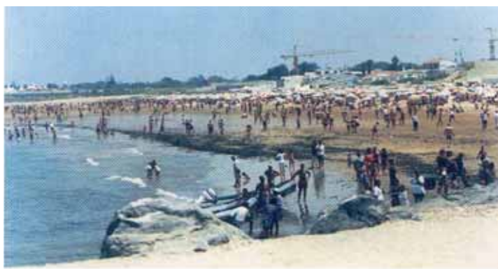
Plage de Skhirate Amphitrite

S'agissant de la première année de son intervention, le sponsor a engagé des actions méritoires qui doivent être capitalisées par une plus grande présence de la commune