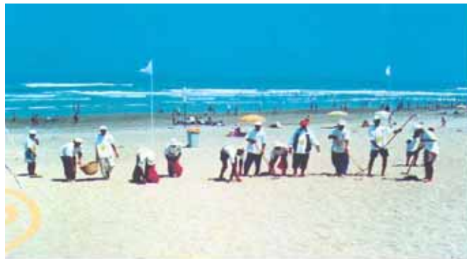
Plage de Ras R'Mel

Malgré l'absence de la commune, le sponsor a fourni un gros effort pour améliorer la plage, il a mis en place des panneaux de sensibilisation dans trois plages non sponsorisées : bar plage, petite plage et Miami