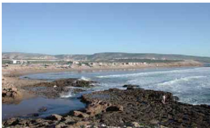
Plage d'Aourir Km 17

Difficulté de vision claire sur l'aménagement de cette plage à cause du projet de la nouvelle station balnéaire « ARGANE BAY »