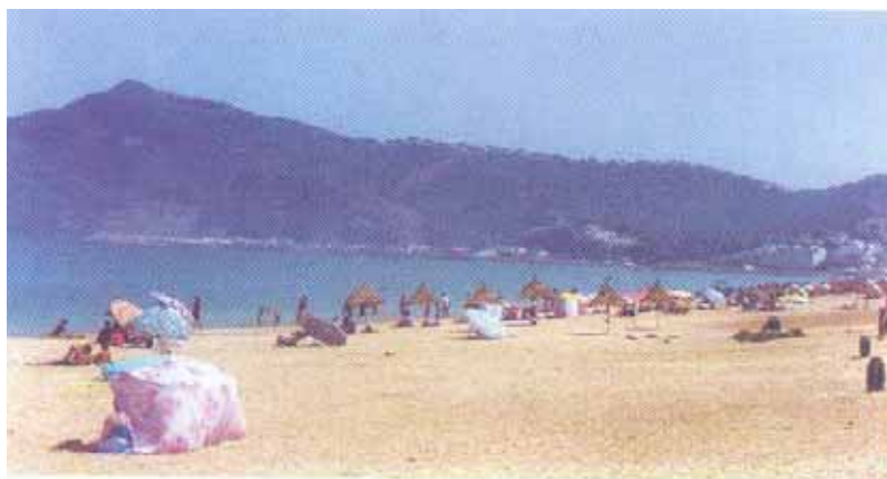
Plage de M'Diq

Plage négligée baignant dans un environnement délabré. Aucun impact visible des efforts fourni par le sponsor et la commune. La plage mérite (et nécessite) un engagement partenarial avec une forte implication de la commune.