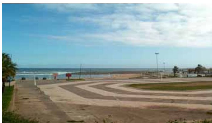
Plage de Témara