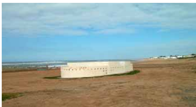
Plage de Sable d'Or