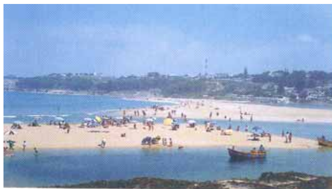
Plage d'El Oualidia

L'effort de l'autorité locale qui joue un rôle important dans la coordination entre le sponsor et la commune augure d'une amélioration de l'état de la plage à l'avenir.