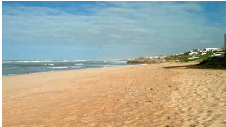
Plage de Guy ville