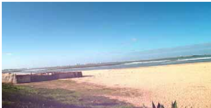
Plage de Mannesman

Malgré les remarques faites au Comité Local lors de la première visite, aucun effort n'a été déployé pour remédier à la situation. La plage de Mannesman mérite une forte implication de la commune pour faciliter le travail du sponsor