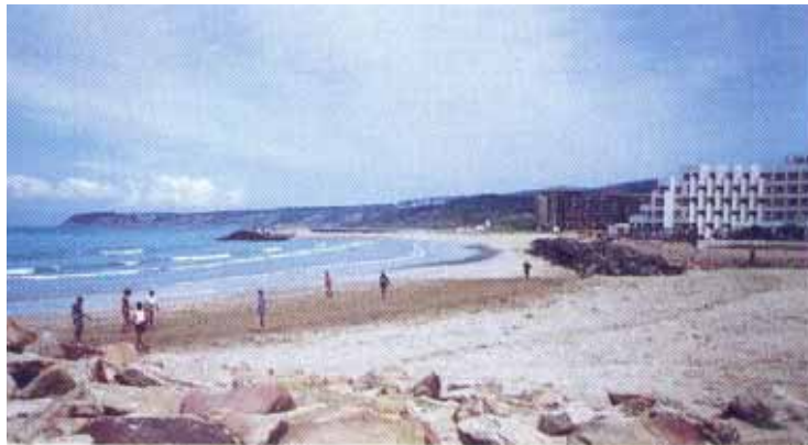
Plage de Malabata

Un effort conjoint commune, autorités locales et sponsor est nécessaire pour donner à cette plage l'état qu'elle mérite