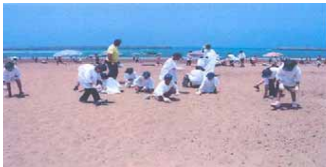
Plage de Salé Médina

Le sponsor a fourni un grand effort au niveau de la plage de Salé, son intervention en 2003 a radicalement changé l'aspect de celle-ci tout en favorisant le côté éducationnel et sensibilisation