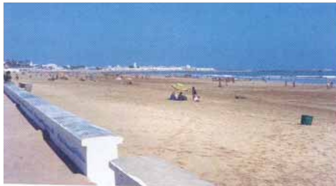
Plage d'El Jadida

La plage d'El Jadida mérite une plus forte implication de la commune pour faciliter le travail du sponsor.