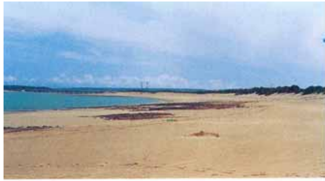
Plage d'Aquass Breich