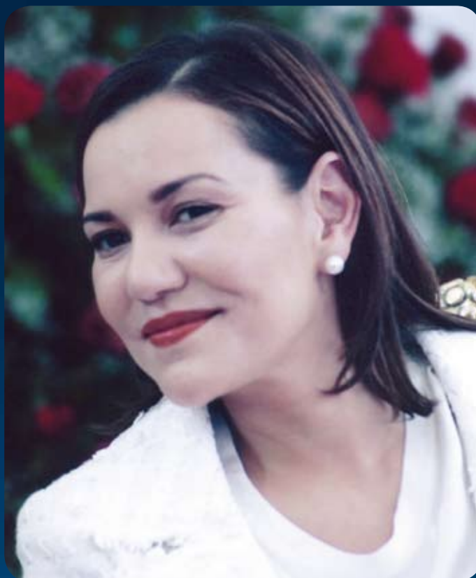
Her Royal Highness Princess Lalla Hasnaa,

President of the Foundation Mohammed VI for the protection of the environment