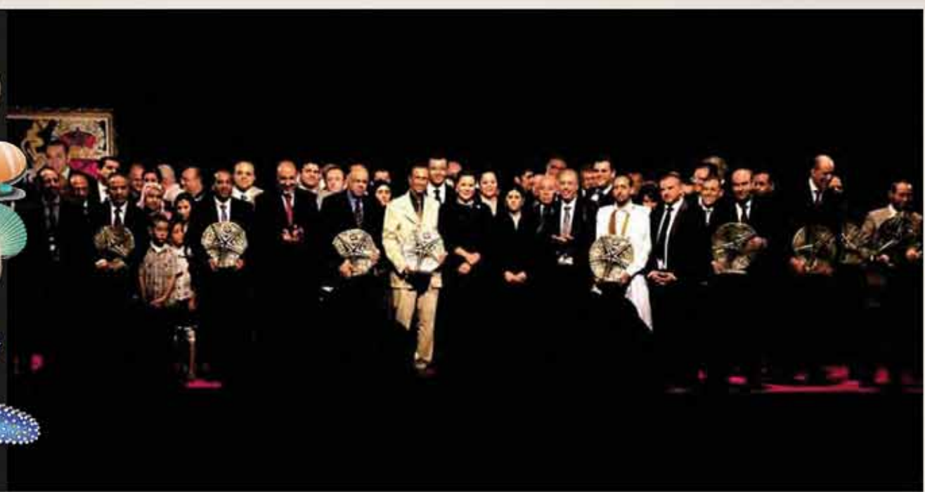
SAR la Princesse Lalla Hasnaa en présence des lauréats du programme "Plages Propres" 2011 à Skhirate