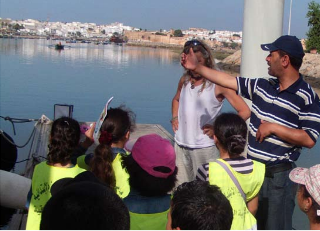
برنامج المدارس الإيكولوجية يشمل مجموعة من المتدربين لشرح القضايا البيئية للمتعلّمين و المتعلمين من خلال زيارات ميدانية

■ زيارة تربوية في إطار حماية المحيط الأطلسي – 25 شتنبر 2012