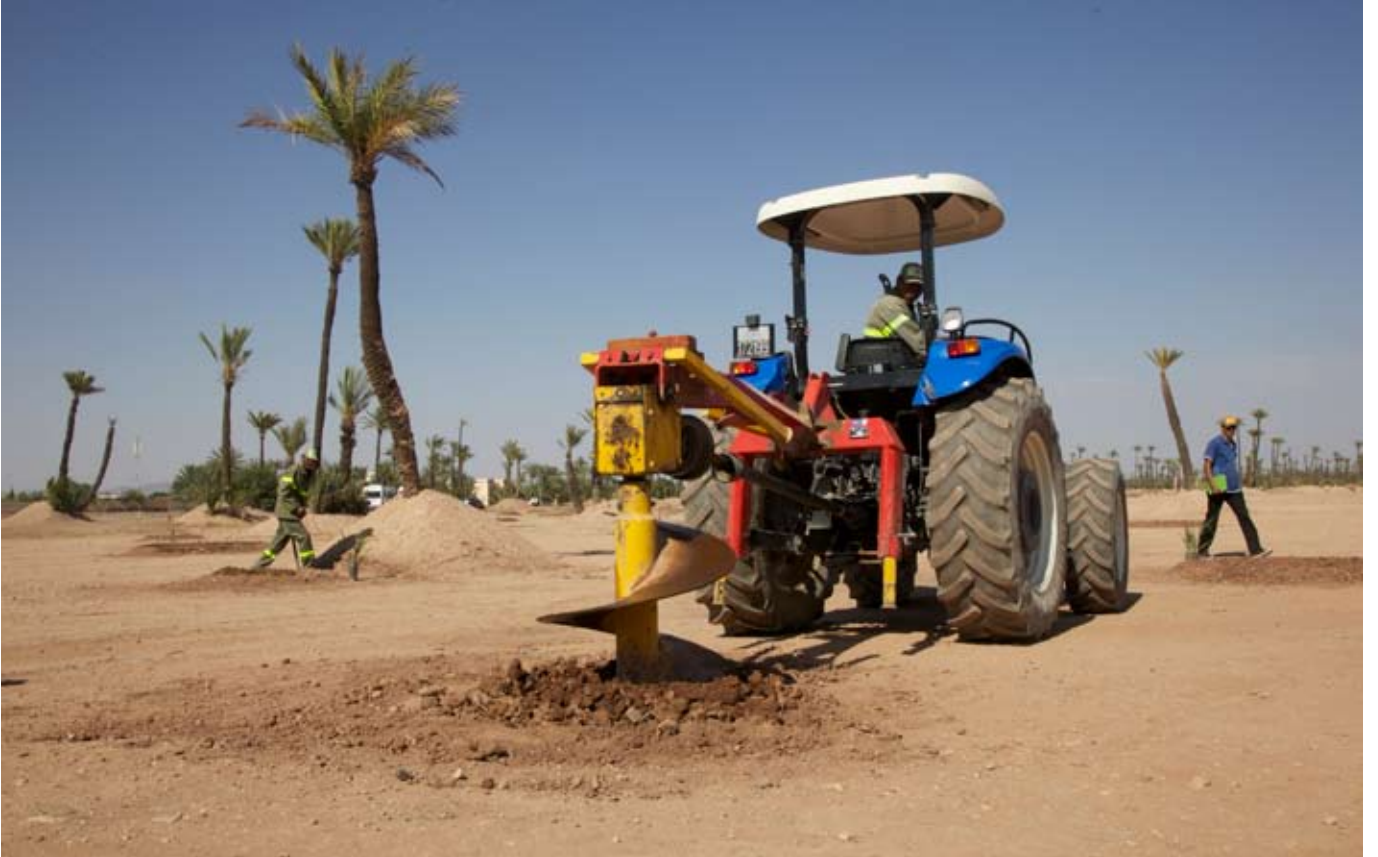
تتميز عمليات زرع النخيل اليوم بدرجة عالية من التقنية و التنظيم، خولت لبرنامج حماية واحة النخيل تحقيق و تجاوز الأهداف المتوقعة لهذه السنة