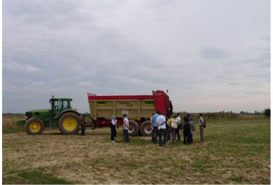
عملية الإستخدام الزراعي للأووال الصادرة عن محطة تصفية المياه للناضور الكبرى

بالنسبة لبرنامج « مقاومات إيكولوجية»، تم تنظيم ورشات تتمحور حول محاور متعلقة ببرامج دعم التنمية المستدامة للبحيرة البحرية مارشيكيا ومحمية المحيط الحيوي ما بين القارات ولفائدة المؤسسات السياحية المعنية ببرنامج المفتاح الأخضر. ومن بين هذه الأعمال تجلت العملية الرائدة في إضفاء القيمة من خلال الاستخدام الزراعي للأووال الصادرة عن محطة تصفية المياه للناضور الكبرى في أكتوبر 2012.