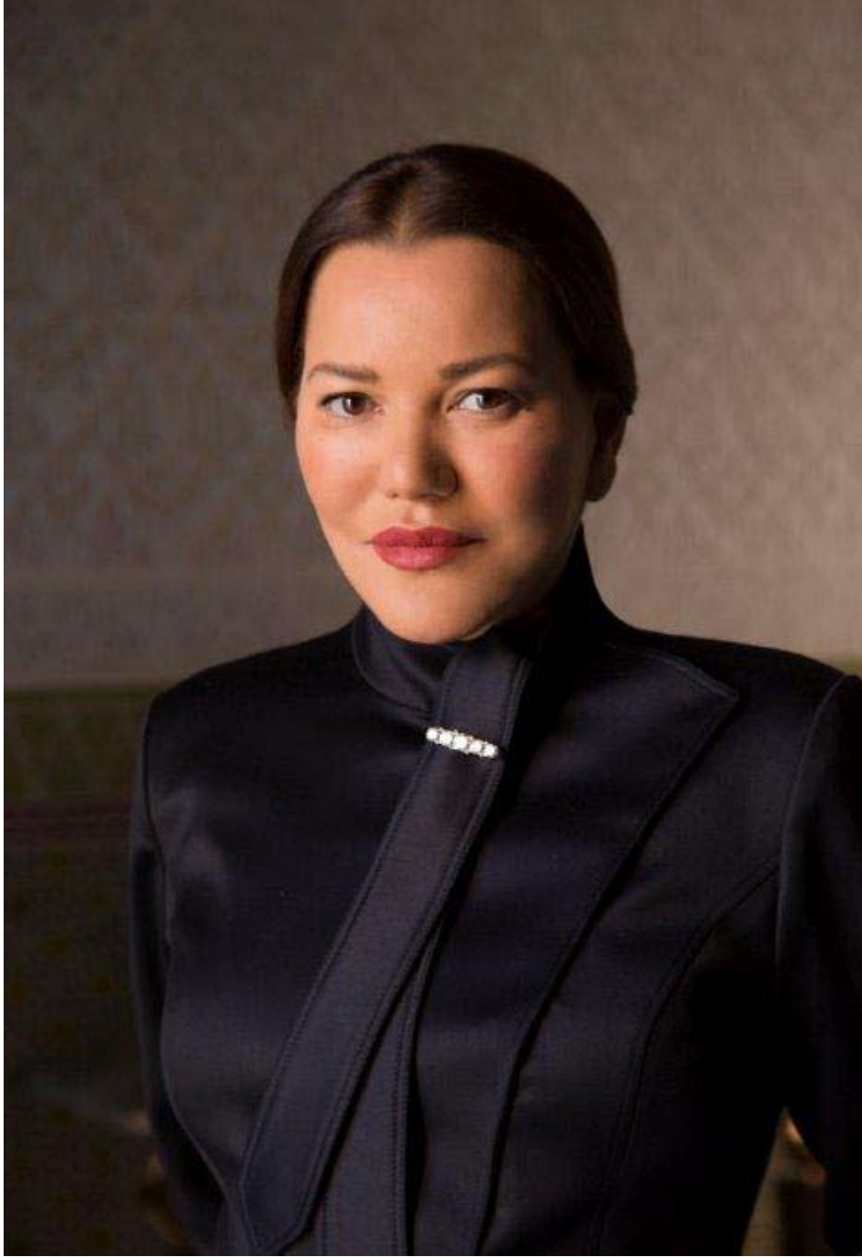
صاحبة السمو الملكي الأميرة الجليلة للا حسناء، رئيسة مؤسسة محمد السادس لحماية البيئة