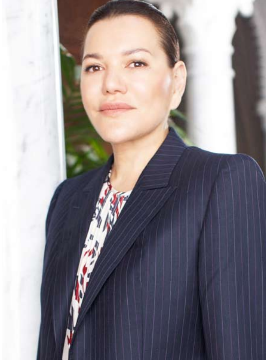
صاحبة السمو الملكي الأميرة الجليلة للا حسناء رئيسة مؤسسة محمد السادس لحماية البيئة