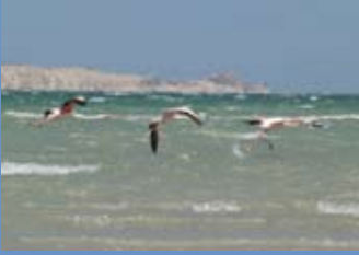
خليج وادي الذهب