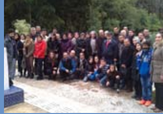
الصحفيون الشباب من أجل البيئة النسخة 12 من المباراة