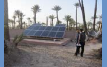
التعويض الطوعي للكربون