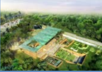
مركز التربية البيئية