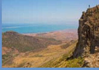
محمية المحيط الحيوي البيقارّي للمتوسط