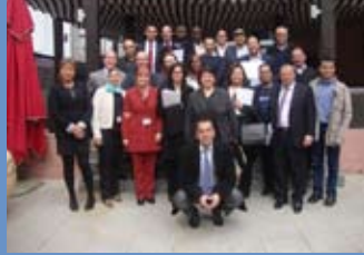
تعزيز قدرات الشباب المهنيين في مجال التواصل البيئي