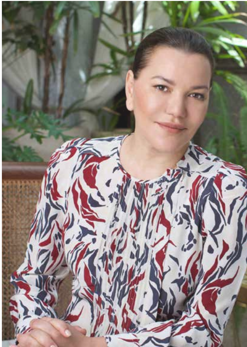
Son Altesse Royale La Princesse Lalla Hasnaa

Présidente de la Fondation Mohammed VI pour la Protection de l'Environnement