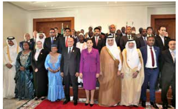
Rabat - 25 Octobre 2017: SAR la Princesse Lalla Hasnaa préside l'ouverture de la 7 ème Conférence Islamique des Ministres de l'Environnement.

Le programme mis en œuvre pour les années 2018 et 2019 donnera une nouvelle impulsion à la coopération entre les deux organismes, partenaires depuis 2007. L'ISESCO appuiera la Fondation dans l'ensemble des pays où elle intervient, pour le partage de son expertise en gestion du littoral, en qualité de l'air, en Éducation au Développement Durable avec notamment ses programmes Éco-Écoles et Jeunes Reporters pour l'Environnement, pour le partage de ses bonnes pratiques, le développement d'outils pédagogiques, pour la formation des formateurs et des jeunes journalistes pour l'environnement,