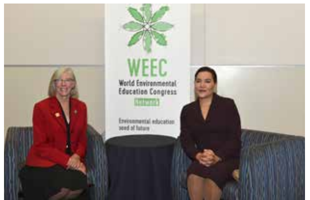
Vancouver, le 09 septembre 2017: SAR La Princesse Lalla Hasnaa reçue par l'honorable Judith Guichon, gouverneur de la Colombie-Britannique, représentante de la Reine.

La Fondation a participé aux sessions plénières, aux ateliers et aux side-events de cette 9 e édition du WEEC.