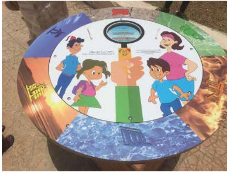
Module rotatif sur les énergies renouvelables