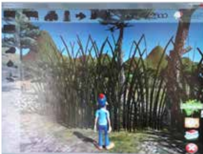
Plate-forme digitale sur les changements climatiques