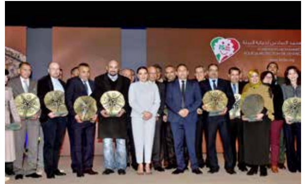
Skhirat - 06 mars 2017 : SAR la Princesse Lalla Hasnaa préside la cérémonie de remise des "Trophées Lalla Hasnaa Littoral Durable" au titre de la deuxième édition.

La participation à ces deuxièmes Trophées Lalla Hasnaa littoral durable était en très nette hausse, avec 109 dossiers présentés. Cet engouement traduit une véritable adhésion à la protection de l'environnement de tous les publics auprès desquels la Fondation mène un travail de sensibilisation et d'éducation.