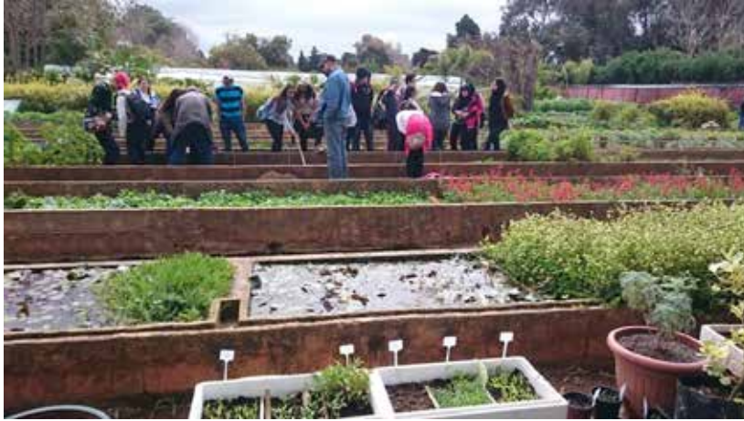
Cours de jardinage aux groupes scolaires et adultes

La Fondation a clos la douzième année de gestion des jardins exotiques de Bouknadel, depuis leur réhabilitation et leur réouverture au public en 2005. Elle est accompagnée dans la préservation de ce patrimoine historique par la Direction Générale des Collectivités locales, le Conseil Préfectoral de Salé et la Préfecture de Salé.