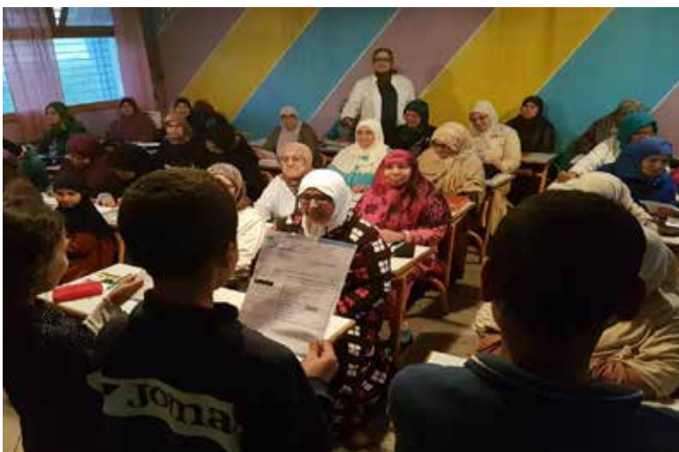
Les élèves sensibilisant les mères de famille pour réduire leur consommation d'énergie (facture à l'appui).