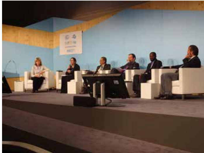
Lors de la COP23, la Fondation a organisé un side event sur l'éducation au changement climatique

durable, modifier profondément leurs comportements et lutter contre le réchauffement climatique.