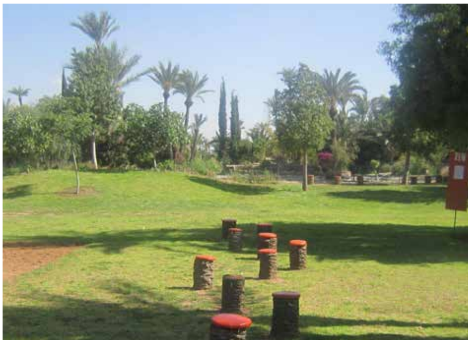
Un établissement portant le label clef verte recycle des troncs de palmiers en tabourets.