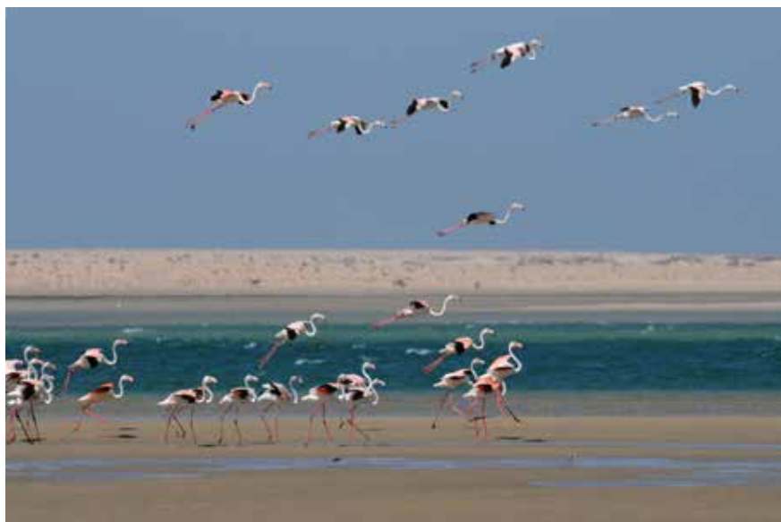
Lagune de Marchica (Nador) : La Fondation accompagne la gestion d'un parc ornithologique pour favoriser la protection des oiseaux et de leurs milieux.

La Fondation continue de développer son expertise et d'implémenter sur les territoires des Aires Protégées, des dispositifs d'éducation à l'environnement et de renforcement des capacités, pour les jeunes, le grand public et les acteurs, favorisant leur protection et leur gestion durable, à travers ses deux projets de zones humides de la Lagune de Marchica et de la Baie d'Oued Eddahab, et également son appui à la mise en valeur de la dimension du développement durable dans les projets menés sur le territoire de la Réserve de Biosphère Intercontinentale de la Méditerranée (RBIM).