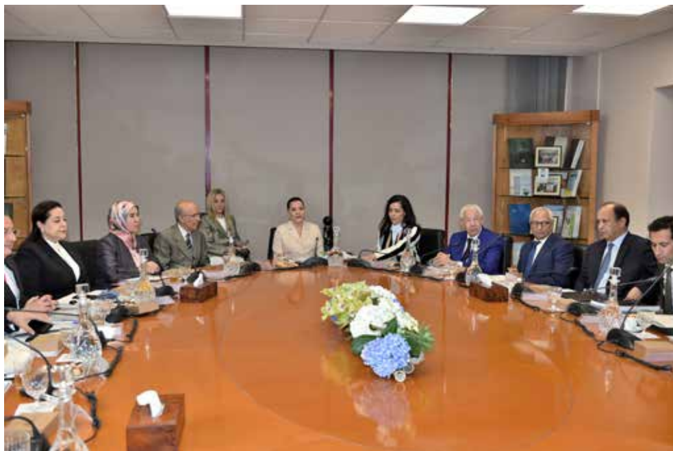
Conseil d'administration - Rabat - 29 juin 2017 : SAR La Princesse Lalla Hasnaa préside le conseil d'administration de la Fondation Mohammed VI pour la Protection de l'Environnement.