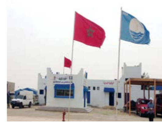
علامة اللواء الأزرق تحظى بتقدير متزايد من قبل المصطافين