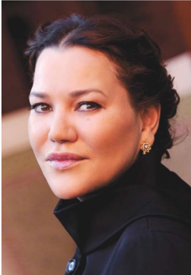
صاحبة السمو الملكي الأميرة الجليلة للا حسناء رئيسة مؤسسة محمد السادس لحماية البيئة

لا شيء يمكن بناؤه اليوم من أجل الغد دون أن يكون نابغاً من الشباب. فلنقف إلى جانب شبيبتنا. مُرادنا أن نساعد الشباب على تصور وتشيد العالم الذي سيعيشون فيه مستقبلاً.