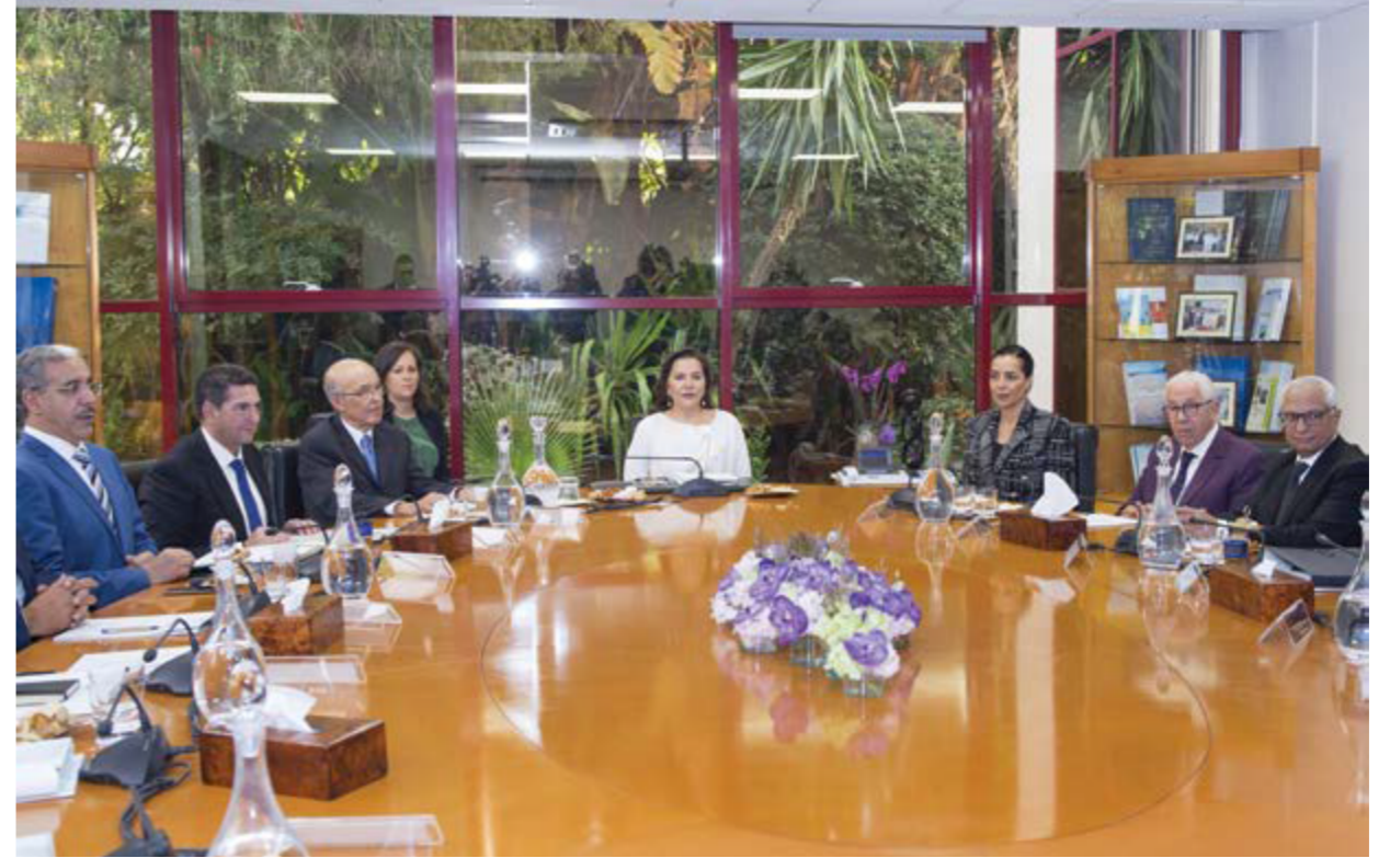
ترأست صاحبة السمو الملكي الأميرة للاحسان يوم 09 دجنبر 2019 المجلس الإداري لمؤسسة محمد السادس لحماية البيئة

. الاتحاد العام لمقاومات المغرب . المجمع الشريف للفوسفاط . المكتب الوطني للكهرباء و للماء الصالح للشرب . الوكالة الوطنية للموانئ . الخطوط الملكية المغربية . البنك المغربي للتجارة الخارجية . المجموعة المهنية لأبنك المغرب . مجموعة أكو . اتصالات المغرب . كوبر فارما . ماروكليبر . شركة شمس . مؤسسة أوننا . المكتب الوطني المغربي للسياحة . البنك الشعبي المركزي . مجموعة هولماركوم . الجمعية المهنية للإسمنت بالمغرب . الإدارة العامة للجماعات المحلية . وزارة الطاقة والمعادن و الماء و البيئة . فيوليا البيئة المغرب . مجموعة الجامعي . الوكالة الفرنسية للتنمية . الصندوق الفرنسي للبيئة العالمية . الشركة العامة للقرقر . صندوق الإيداع و التدبير . مؤسسة البنك الشعبي للتربية و الثقافة . الوكالة الوطنية لإنعاش الشغل والكفاءات . وزارة التربية الوطنية . وكالة الانعاش والتنمية الاقتصادية والاجتماعية لعمالة وأقاليم الجهة الشرقية . وكالة الانعاش والتنمية الاقتصادية والاجتماعية لعمالة وأقاليم جنوب المملكة. . برنامج الأمم المتحدة للبيئة . ليديك . ميد زد . وكالة تهيئة ضفة وادي أبي رقراق . سوزر البيئة . وكالة طنجة الخاصة بالبحر الأبيض المتوسط . العمران . نستلي المغرب . وكالة الإنعاش والتنمية الاقتصادية لأقاليم شمال المملكة. . برنامج الأمم المتحدة للتنمية . أمانديس طنجة . أمانديس - تطوان