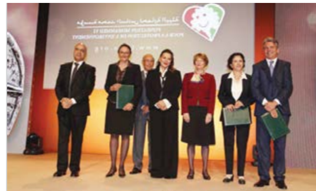
حازت مؤسسة محمد السادس لحماية البيئة على صفة «الجمعية المسؤولة»، وهي شهادة تمنحها وكالة التصنيف الدولية «فيجيو»

يُذكر أن الأعضاء المنخرطين في مؤسسة محمد السادس لحماية البيئة، ناهيك عن مجلس إدارتها ومسيرتها وشركائها ومعاونيها، كلهم التزموا خطياً باحترام ميثاق المسؤولية الاجتماعية والبيئية الخاص بالمؤسسة.