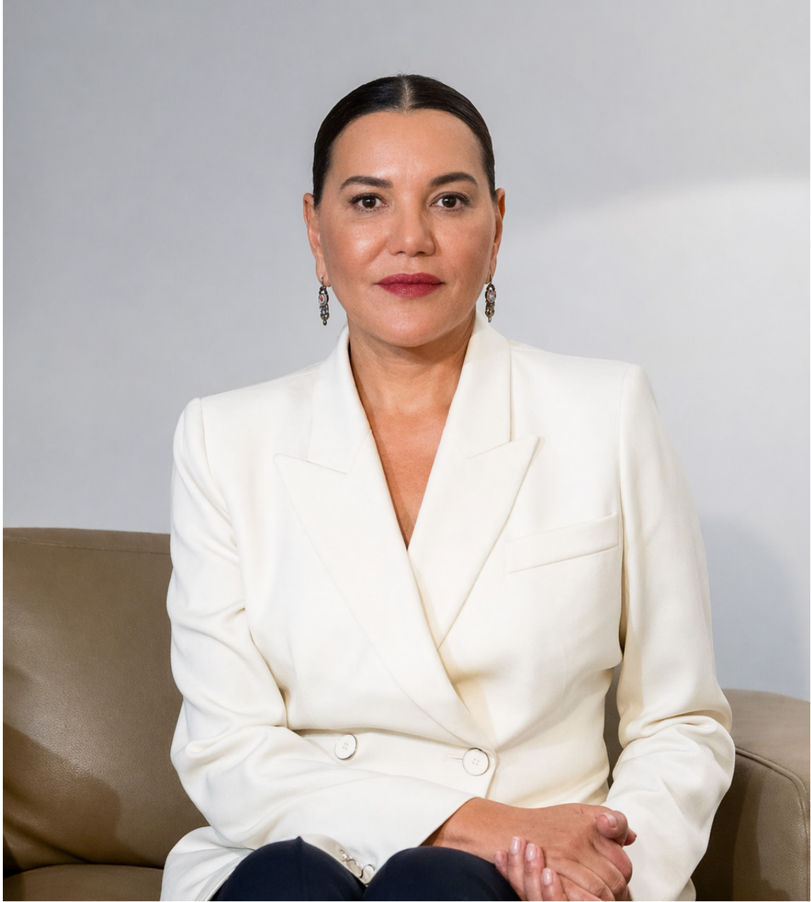
صاحبة السمو الملكي الأميرة للا حسناء رئيسة مؤسسة محمد السادس لحماية البيئة