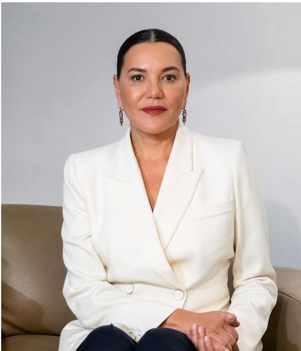
Son Altesse Royale La Princesse Lalla Hasnaa Présidente de la Fondation Mohammed VI pour la Protection de l'Environnement